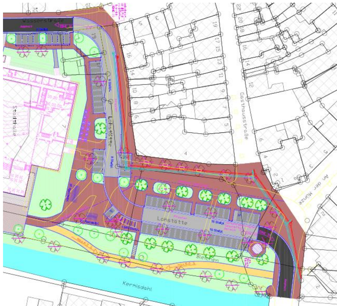
Stadthallenumfeld BA I + II