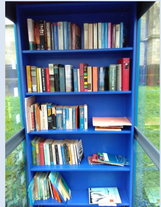
Bibliothek am Ludgeriplatz, Duisburg Neudorf