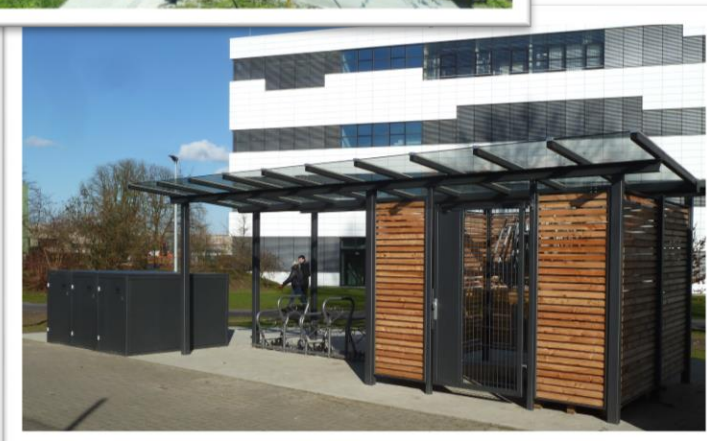
Europa-RadBahn Kleve - Kranenburg 1.BA Kle/Wiesenstr. bis Flutstraße