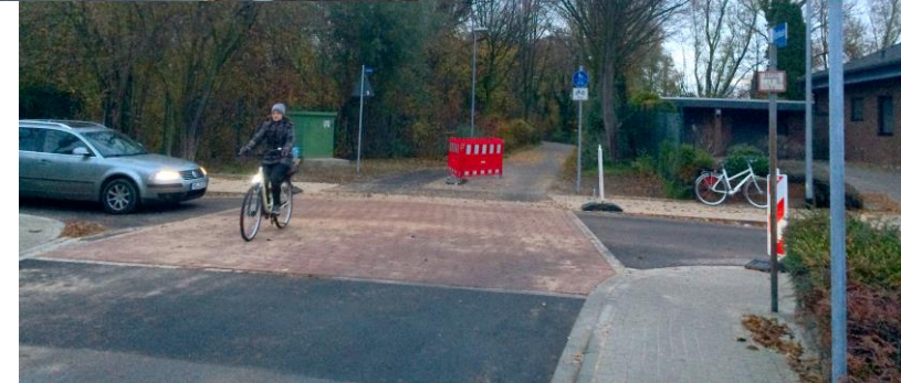
Umsetzung Querung Steinstr.-Flasbloem Fördermaßnahme Land Fertigstellung November 2018