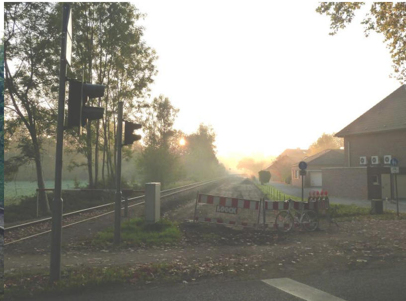
Europa-RadBahn Kleve - Kranenburg 2.BA Kle/Flutstraße - Kra/Hettsteg - Tiefbauarbeiten