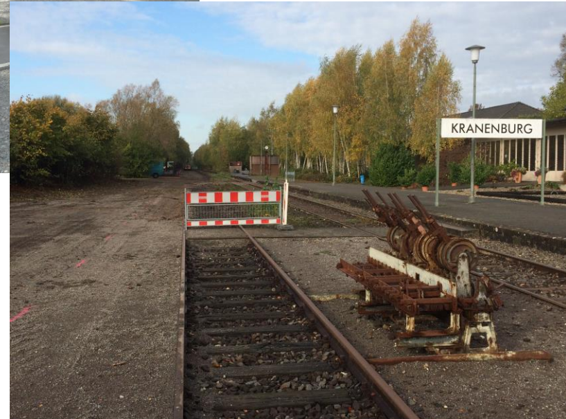
Europa-RadBahn Kleve - Kranenburg 2.BA Kle/Flutstraße - Kra/Hettsteg - Tiefbauarbeiten