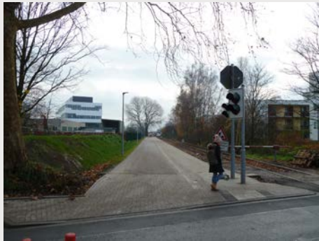
1. Bauabschnitt Wiesenstraße – Flutstraße getrennter Fuß- u. Radweg