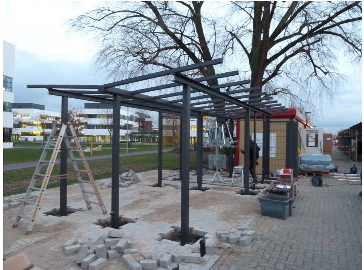
1. Bauabschnitt Wiesenstraße – Flutstraße Fahrradservice am Draisinenbahnhof