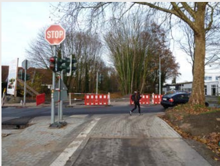
1. Bauabschnitt Wiesenstraße – Flutstraße Querung Flutstraße