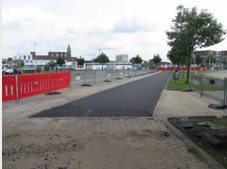
1. Bauabschnitt Wiesenstraße – Flutstraße Querung Wiesenstraße und Radwegführung Kirmesplatz