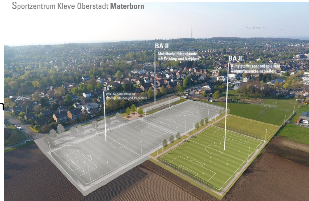
Sportzentrum Kleve Oberstadt Materborn

Bund: 2,58 Mio € – Förderprogramm „Sanierung kommunaler Einrichtungen“ - (45%)