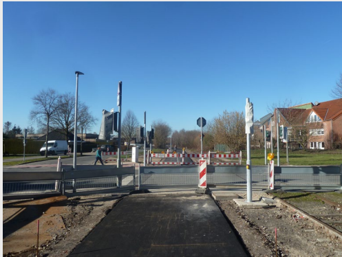
Europa-RadBahn Kleve - Kranenburg 2.BA Kle/Flutstraße - Kra/Hettsteg - Tiefbauarbeiten