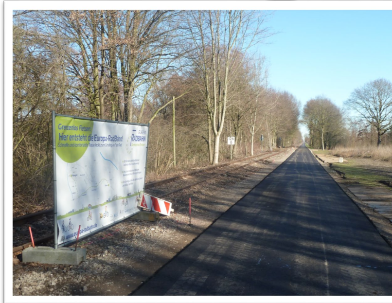
Europa-RadBahn Kleve - Kranenburg 2.Bauabschnitt Kranenburg