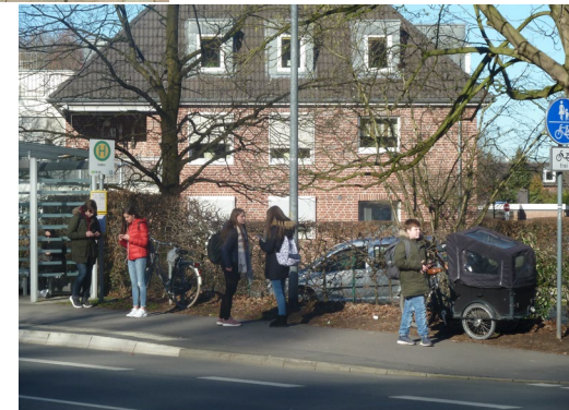
Förderung und Testen von Lastenräder (BMU)