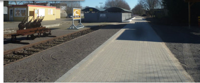
Europa-RadBahn Kleve - Kranenburg 2.Bauabschnitt Kranenburg