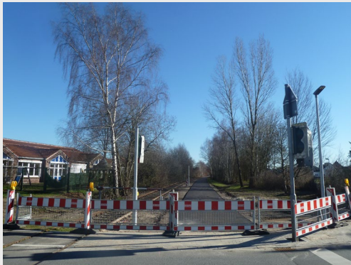
Europa-RadBahn Kleve - Kranenburg 2.BA Kle/Flutstraße - Kra/Hettsteg - Tiefbauarbeiten