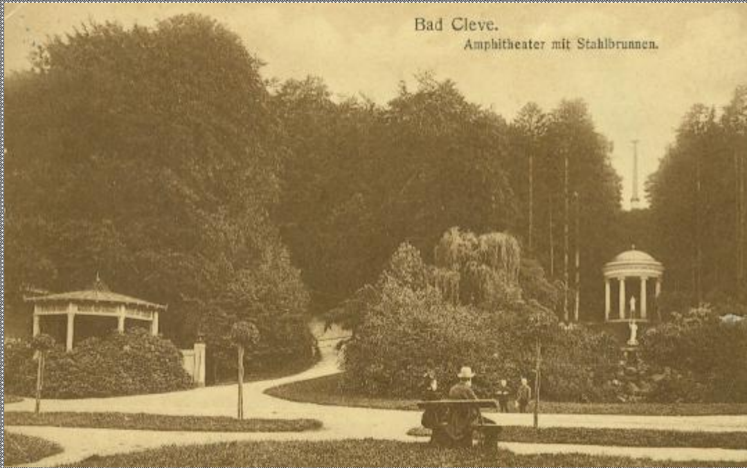
Bad Cleve. Amphitheater mit Stahlbrunnen.