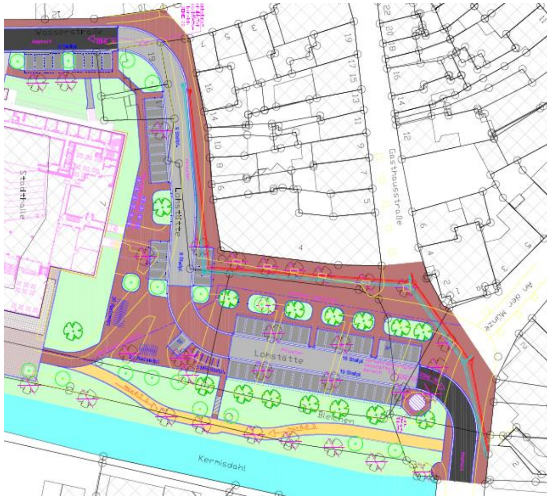
Stadthallenumfeld BA I + II